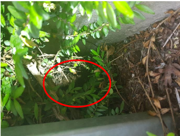
Rotteløbegang i buskadset