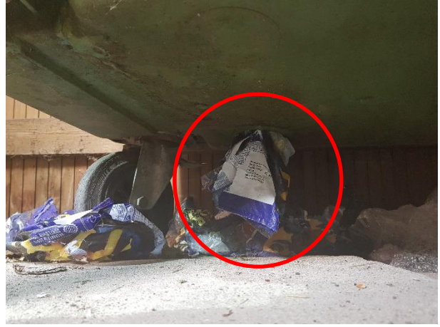
Rotterne har trukket affald ud af containeren