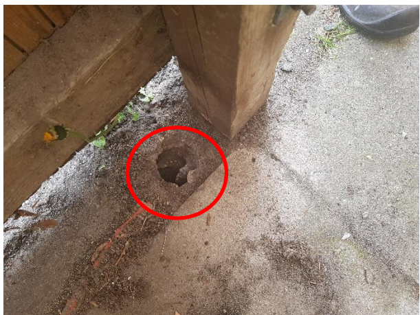
Rottehul under skuret