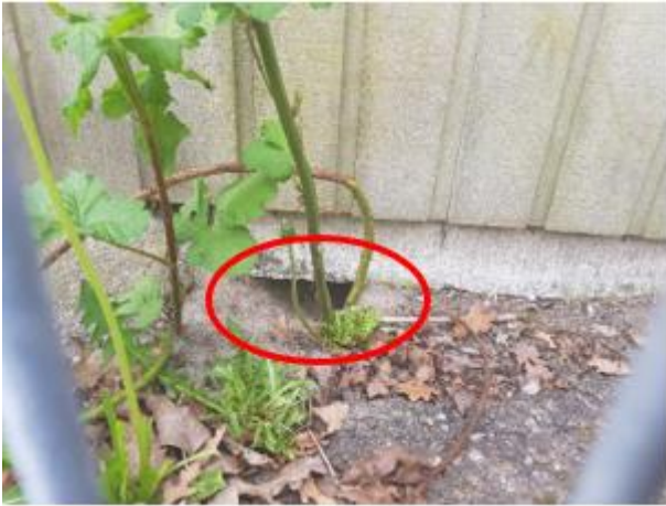
Rottehul under skuret