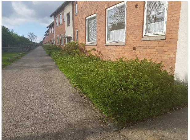
Buskads, som skal fjernes (hele rækken)