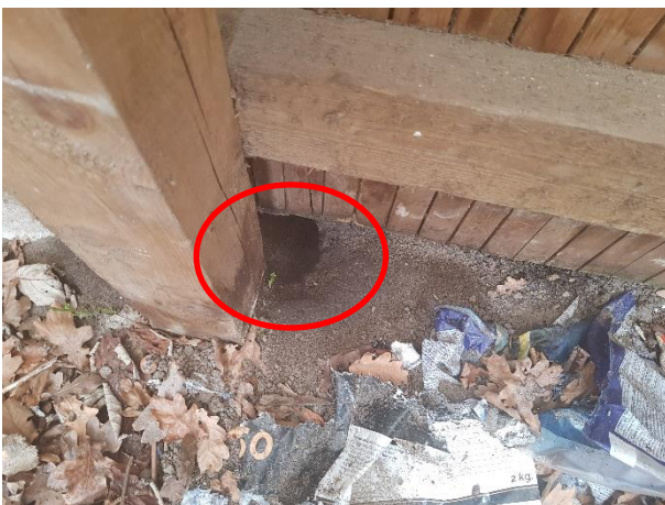
Rottehul under skuret